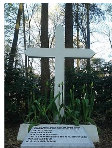
Het monument dat de plaats markeert waar op maandag 20 november 1944 zes Nederlanders werden gefusilleerd.

https://historizon.nl/event/het-kruis-op-de-berg