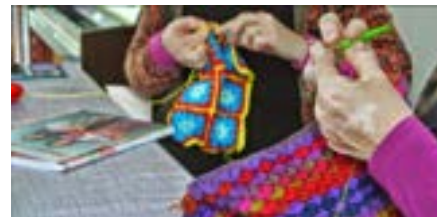
De creagroep druk aan het werk

Buiten: jeu de boules en de wandelen. Koffieklets was wegens gebrek aan belangstelling gestopt.